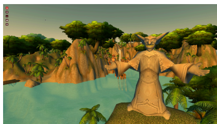
Une carte de World of Warcraft

sans être arrêté par les cloisons ou les limites du jeu. Toutes les cartes de vos jeux favoris sont là ! De Mario à World of Warcraft, Half life, Métroid, GTA, Zelda, etc. Plusieurs plateformes sont représentées, PC, Wii, Game Cube, Playstation. Sur certaines cartes, les alternances Jour Nuit sont présentes et les textures animées (les endroits avec de l'eau par exemple). C'est beau et on se surprend à explorer avec plaisir ces cartes étrangement calmes comparées aux versions « in game ». https://noclip.website/